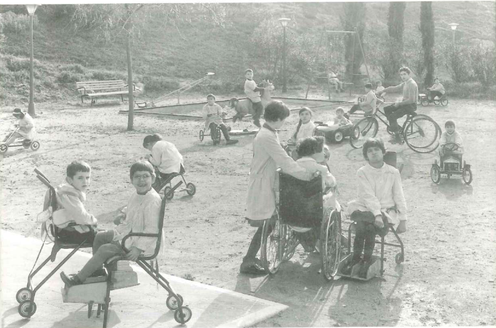
Inicis del centre pilot. Pati.

Si coneixes algú de la foto ens ho fas saber ... Escriu a l'adreça de correu electrònic o truca'ns.